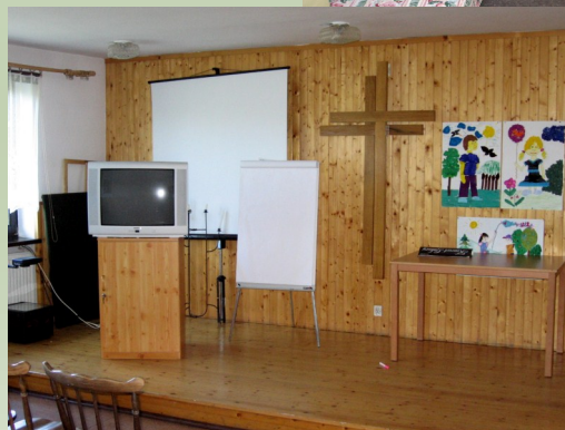
Sala spotkań, sala konferencyjna