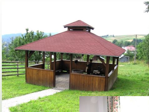
Wiata z miejscem na grill i ognisko