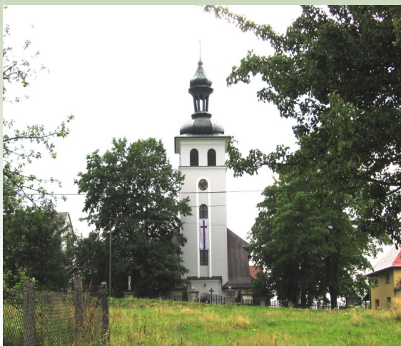
Kościół ewangelicki w Istebnej

W maju 1927 r. rozpoczęto kopanie fundamentów, a w niedzielę 7 sierpnia tegoż roku odbyła się uroczystość poświęcenia kamienia węgielnego. W niedzielę 3 sierpnia 1930 roku odbyło się poświęcenie Kościoła w Istebnej, którego dokonał ks. biskup Juliusz Bursche z Warszawy.